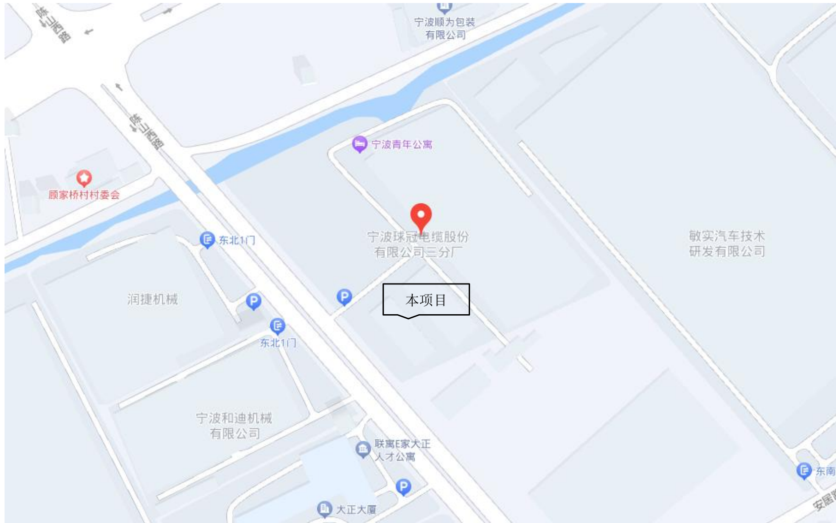
附图 1：项目地理位置图