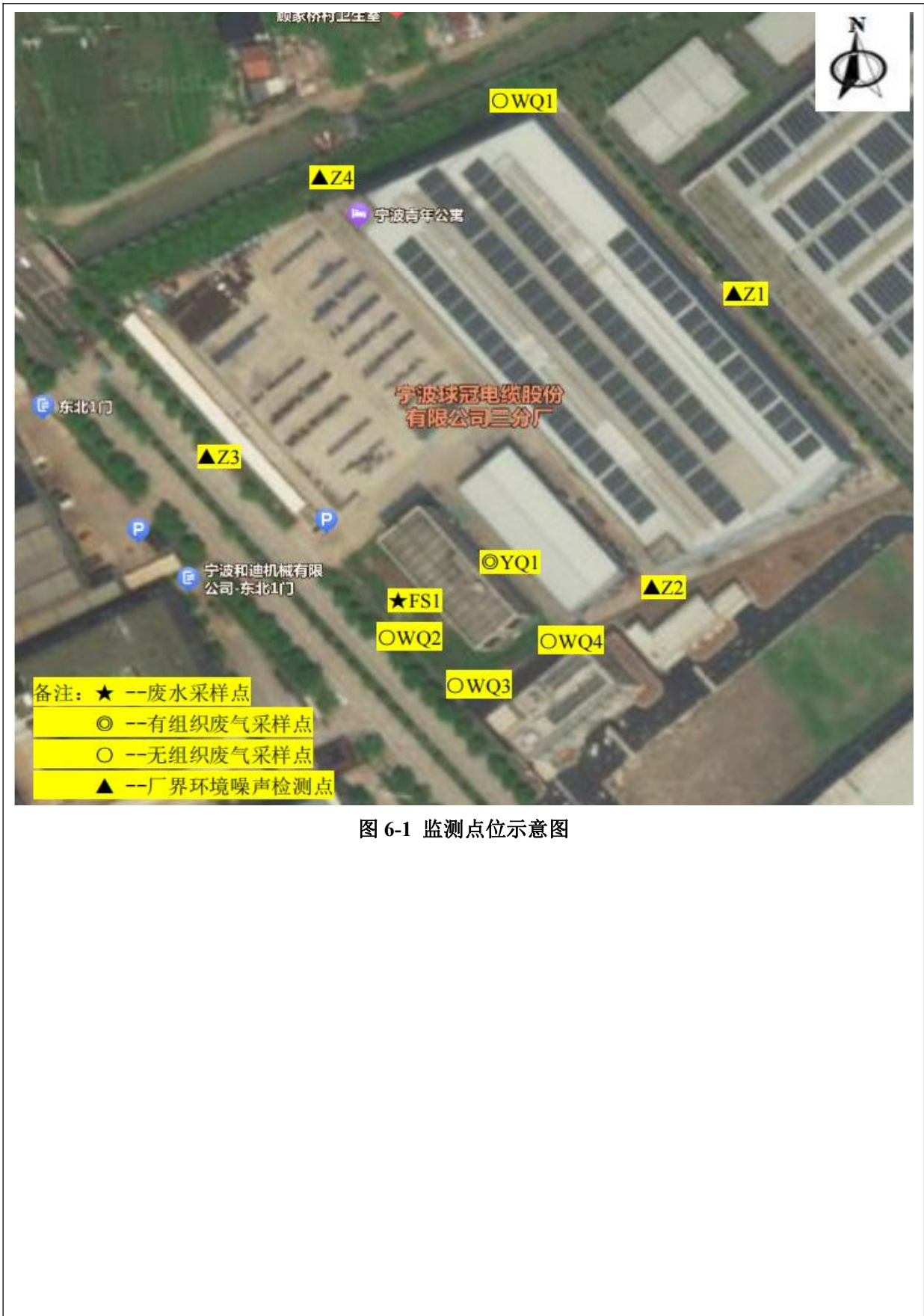
图 6-1 监测点位示意图