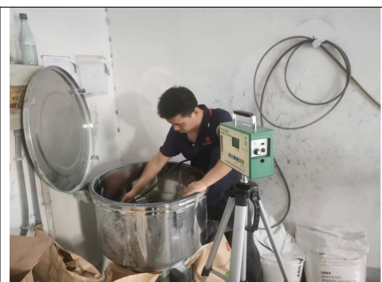
图 2 现场检测图