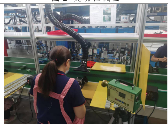
图 4 现场检测图