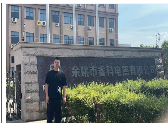
图 1 现场检测图