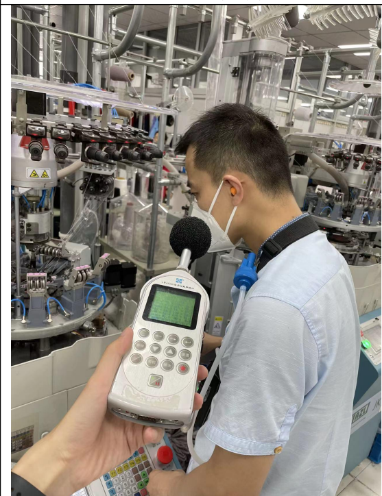
图 3 现场检测图