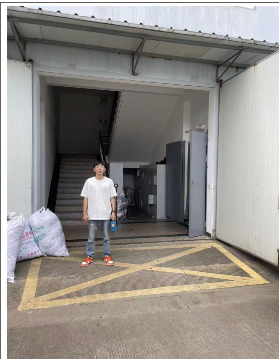
图 1 企业大门