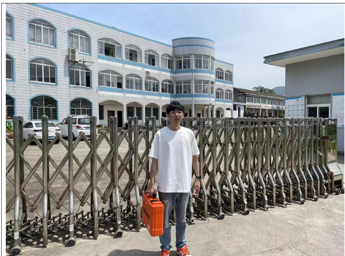
图 1 企业大门