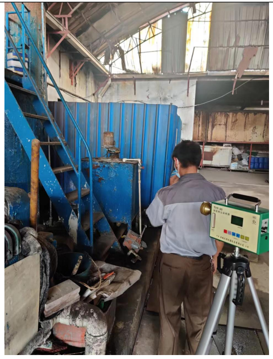
图 4 污水处理站