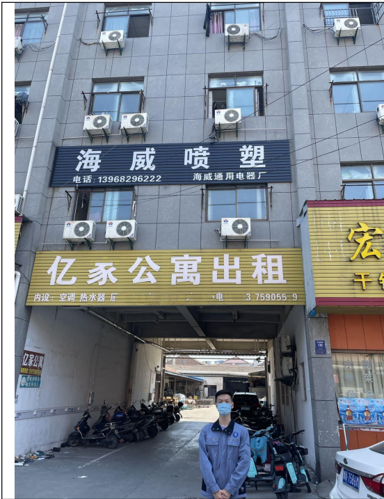
图 1 企业大门