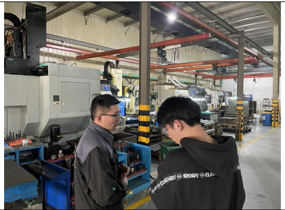
图 2 现场调查图