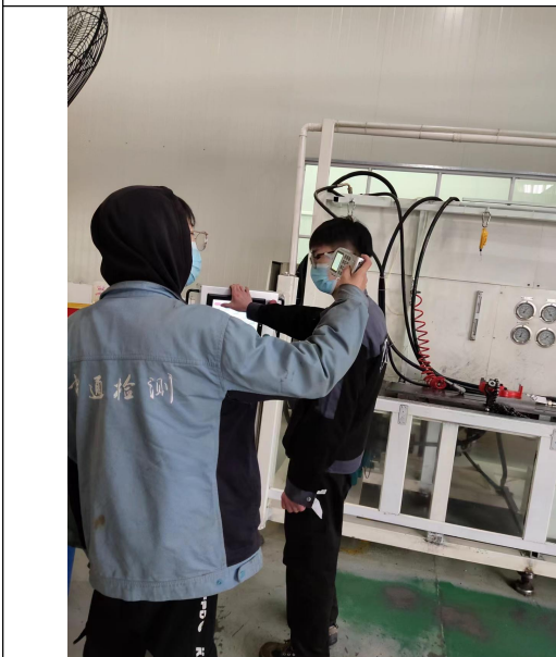
图 3 现场检测图