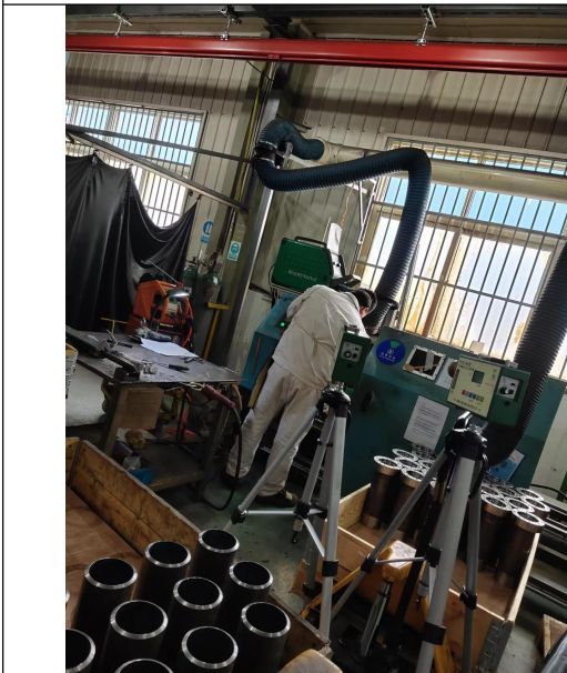
图 5 现场检测图