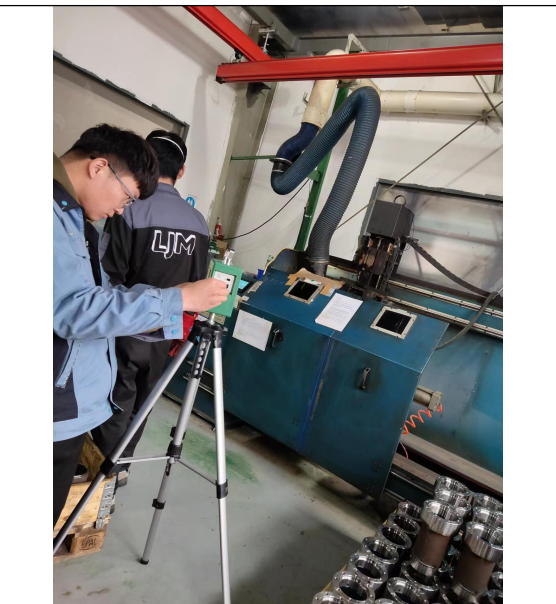
图 4 现场检测图